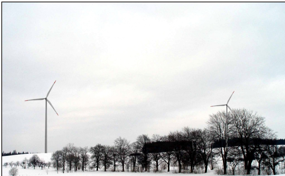
Obr.1: Uvažované větrné elektrárny při pohledu z cesty na konci obce.